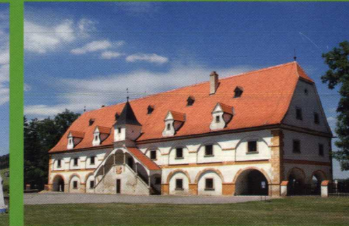
GPS Loc: 48°47'0.6"N, 16°12'1.863"E