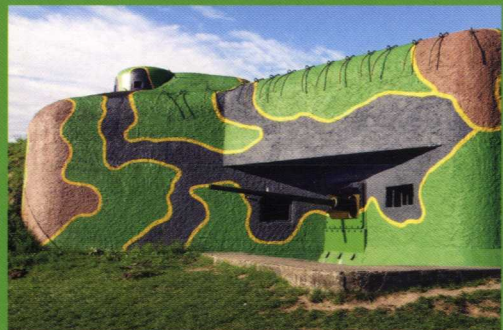
GPS Loc: 48°47'37.96"N, 16°0'26.892"E

Areál čs. opevnění Šatov | Areál MHD v Brně-Lišni | Kovárna v Těšanech | Stará huť u Adamova | Šlakhamr v Hamrech nad Sázavou | Větrný mlýn v Kuželově | Vodní mlýn ve Slupi