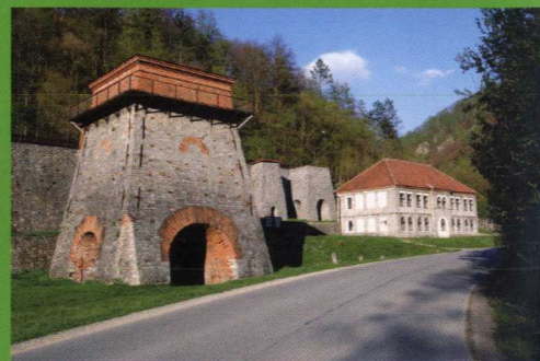
GPS Loc: 49°18'24.588"N, 16°40'40.855"E