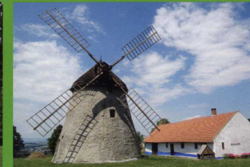
GPS Loc: 48°51'9.753"N, 17°29'45.023"E