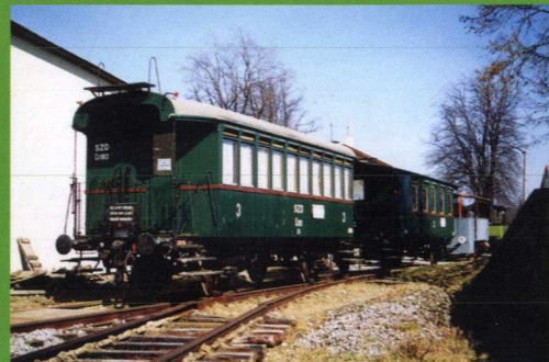
GPS Loc: 49°12'4.418"N, 16°41'39.936"E