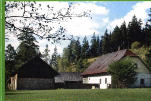
Pouze příležitostné akce (v rekonstrukci)