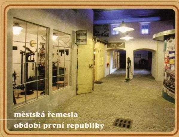
městská řemesla období první republiky

zámečník • knihař • švec • krejčí • hodinář • zubař • kadeřník • hokynář • hospodský